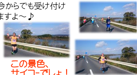
この景色、サイコでしょ！

11月5日、今年も登米市でのカッパマラソンに木楽々くらぶ有志が出場しました。秋晴れのさわやかな風が吹く絶好のマラソン日和♪ 今年の木楽々くらぶのランナーは7名と例年に比べて少なかったのですが、皆さん日頃のトレーニングの成果もあり当日はベストコンディション！！約21kmのハーフを見事に走り切りました!(^^)! お疲れ様でした。来年はもっとたくさんの方にご参加いただければ幸いです。興味のある方は、今からでも受け付けますよ～♪