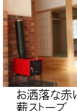
お酒落な赤い薪ストーブ