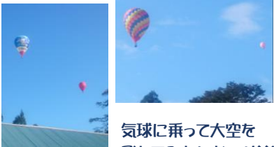
気球に乗って大空を飛んでみたいな~!(^^)!

10月14~16日に「一関・平泉バルーンフェスティバル」が開催され、16日早朝には、会社の上空を色とりどりの熱気球がたくさん飛ぶ姿を間近で見て圧倒されました。