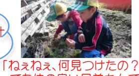
「ねえねえ、何見つけたの?」 とつても仲の良い兄弟なんです

ランチメニュー! 味付けおこわ、きりたんぼ汁 熱々のおでんに、春巻き カボチャサラダ、 フルーツなどなど